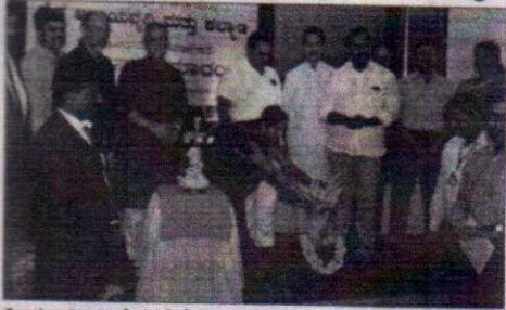
ಮೀನುಗಾರಿಕಾ ಕಾಲೇಜಿನಲ್ಲಿ ರೈತ ಆದಾಯವೃದ್ಧಿ ಮತ್ತು ಕಲ್ಯಾಣ- ಒಂದು ದಿನದ ಕಾರ್ಯಾಗಾರದ ಸುತ್ತವಾರ ಸಭೆಯು.