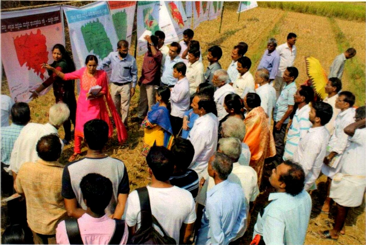
Daregudde Farmers sensitized on soil sampling methods