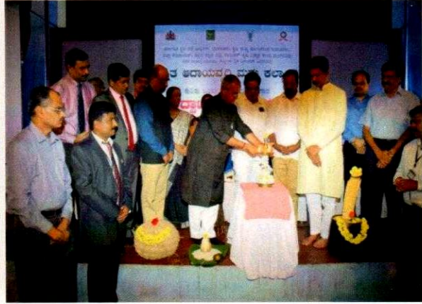
Inauguration of first stakeholders meeting on 23.12.16 at College of Fisheries, Mangalore