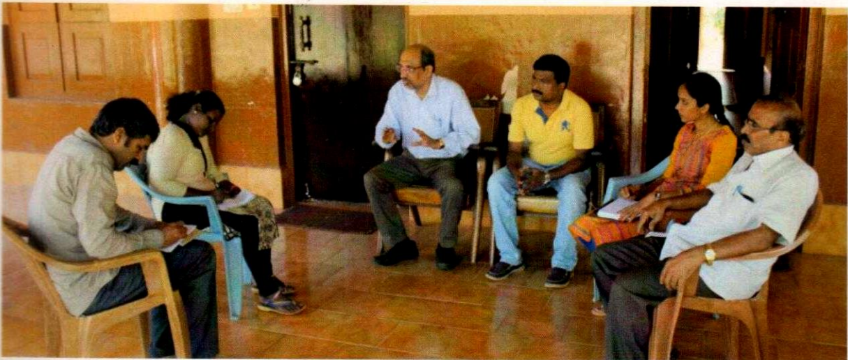
Fig 3. Press Meet at Travellros Bunglow, Moodabidre on 5 th Dec 2016