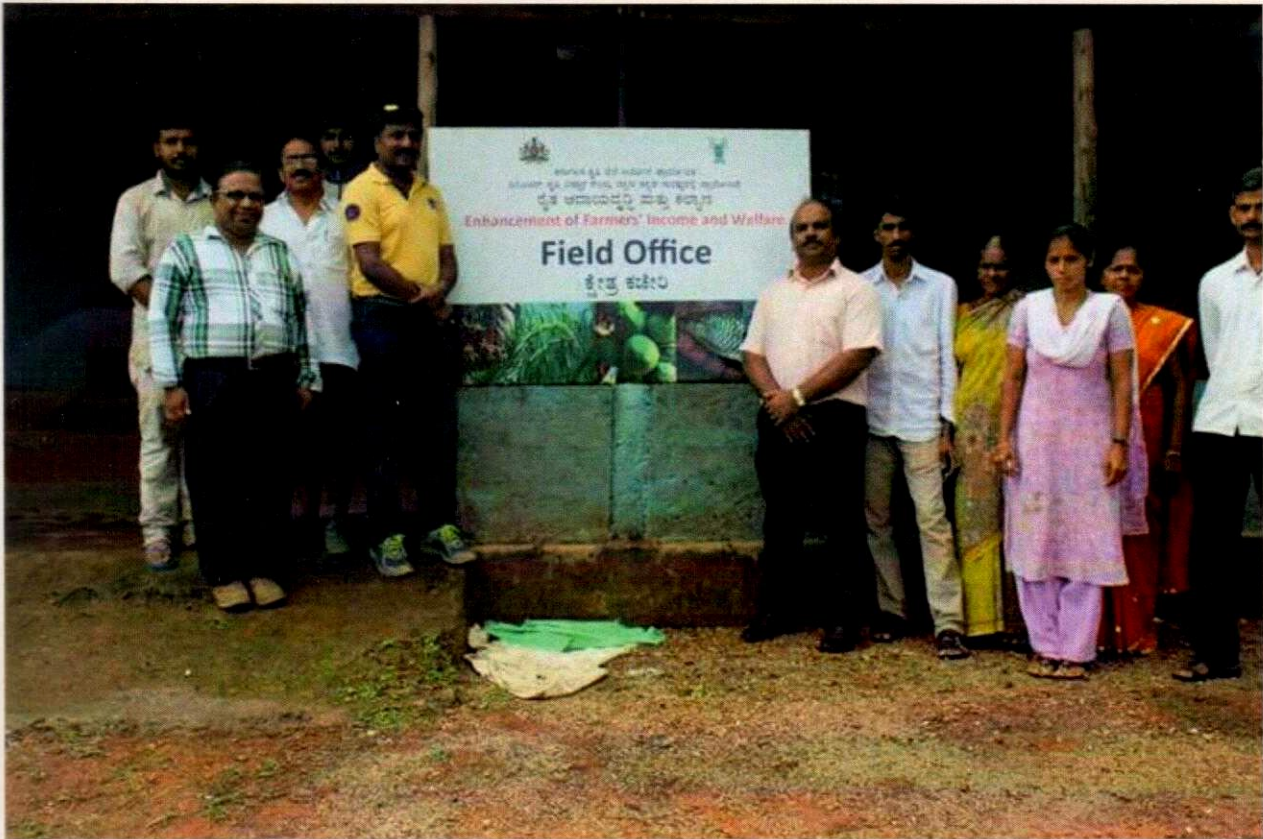
Visit of ICAR-KVK scientists to Dargudde village and conducted Grama Sabhe