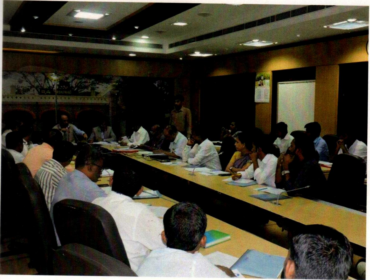
Progress Review Meeting at KAPC, Bangalore on 20.09.17