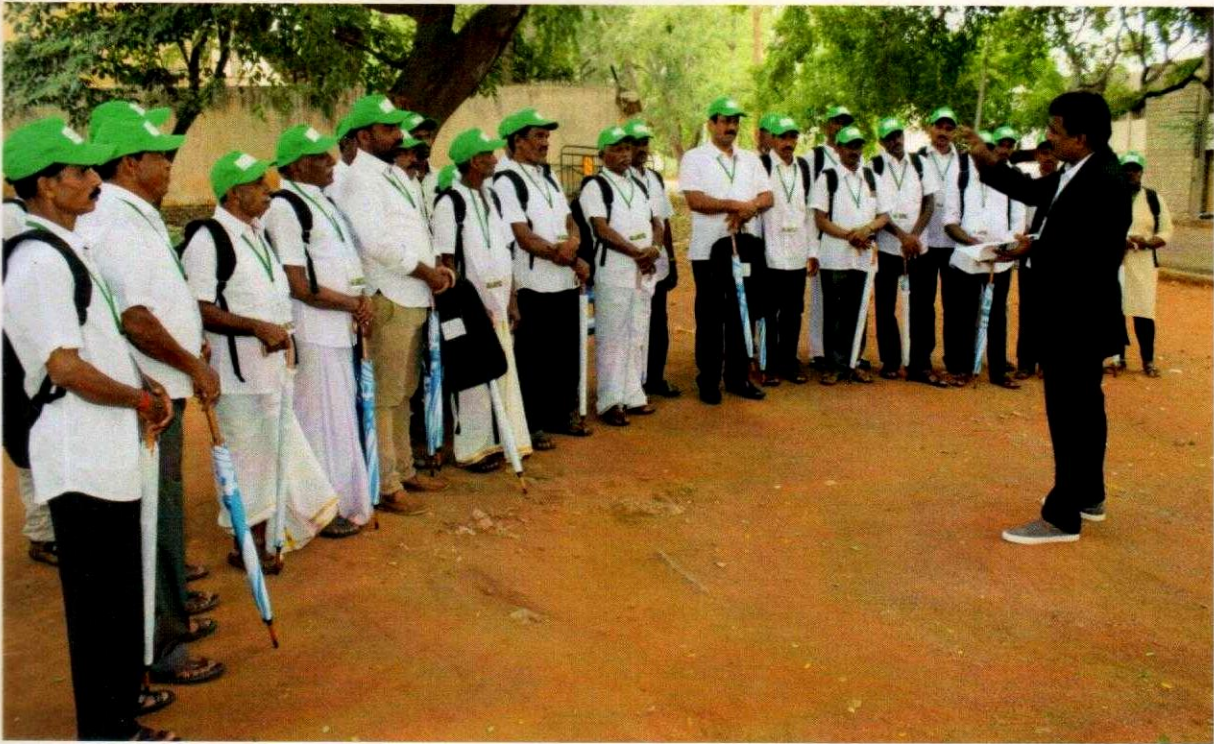
Farmers were taken to Dairy and Veterinary College Hebbal during their ISEC visit