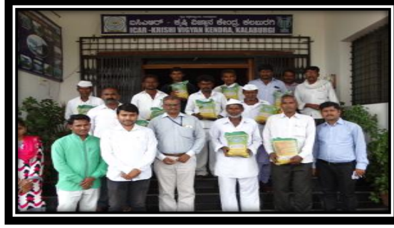
ಸೂರ್ಯಕಾಂತಿ ಬೀಜವನ್ನು ತೆಲ್ಲೂರ ರೈತರಿಗೆ ನೀಡಿರುವುದು.

ಕೃಷಿ ವಿಜ್ಞಾನ ಕೇಂದ್ರ ಕಲಬುರಗಿಯ ತೆಲ್ಲೂರ ಗ್ರಾಮದಲ್ಲಿ ಕೈಗೊಂಡ ಪ್ರಥಮ ಸಾಲಿನ ಪ್ರಾತ್ಯಕ್ಷಿಕೆಗಳ ವಿವರ :