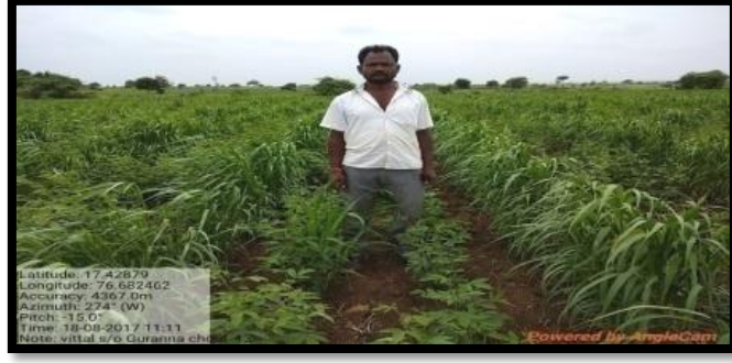
ನವಣೆ HMT-101 ತಳಿಯ ತೆಲ್ಲೂರ ರೈತರ ಹೊಲದಲ್ಲಿ ಪ್ರಾತ್ಯಕ್ಷಿಕೆ